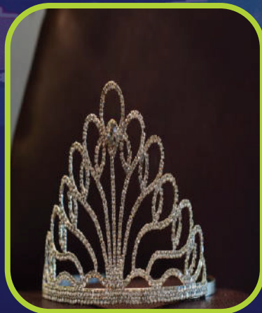
PAREO PRIMA -10%