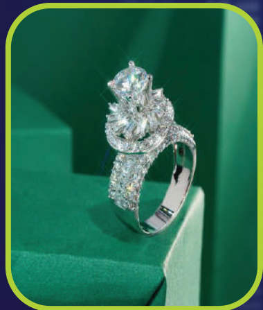
ROI DIARIO 1% - 2%