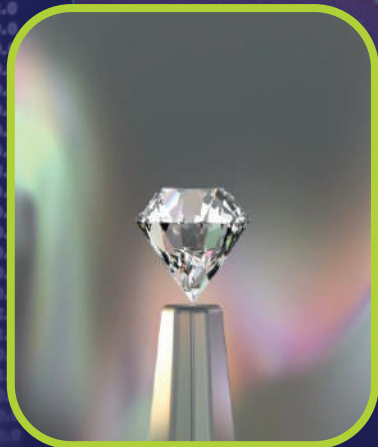
REFERENCIA DIRECTA PRIMA -10%