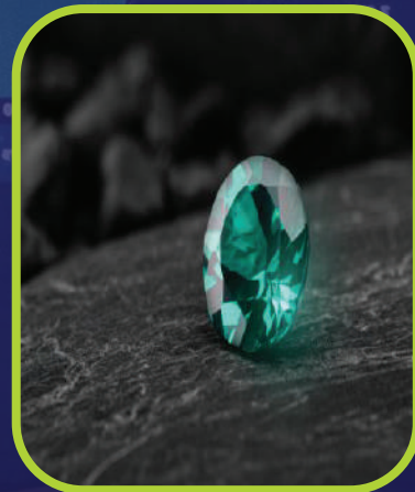
CLUB DE LA REALEZA INGRESO