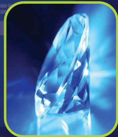
PREMIOS Y RECOMPENSAS